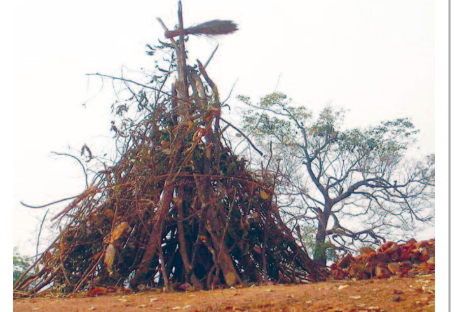
कवर्धा। बसंत ऋतु के प्रमुख त्यौहार होली को लेकर अब तैयारियां तेज हो गई हैं। कवर्धा सहित अंचल में की जा रही होलिका दहन के लिए उत्साही बच्चों व युवाओं द्वारा लकड़ी आदि जुटाया जा रहा है। वहीं कई होलिका दहन समितियों द्वारा इसके लिए बकाया चंदा भी एकत्र किया जा रहा है।