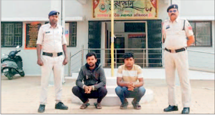
बोलरो पिकअप वाहन से अवैध तस्करी करते आरोपियों को दबोचा